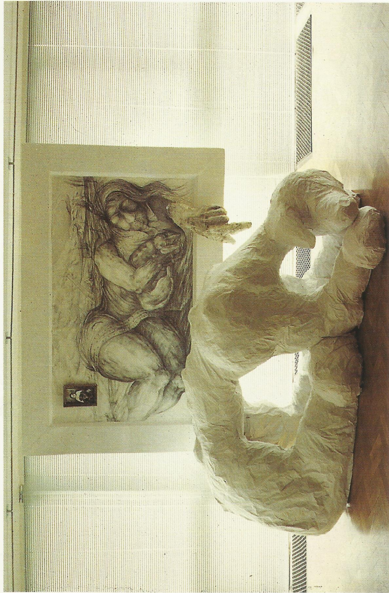
„WIERNOŚĆ” rysunek + instalacja 250 x 300 x 400 cm