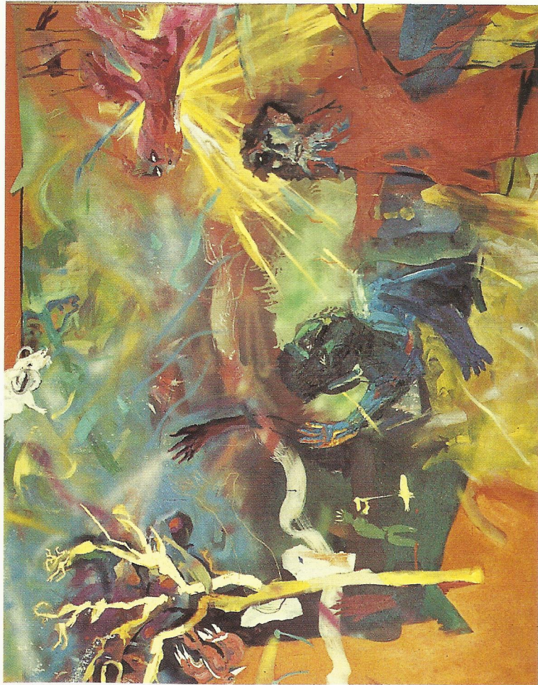
„RAJSKI PROFOK“ olej, płótno 200 x 160 cm